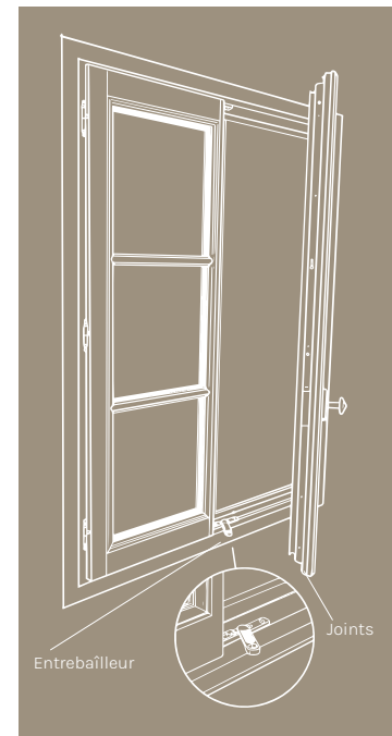
Fenêtre de notre gamme Estibelle

Si vos menuiseries sont équipées de parties métalliques ( seuil aluminium ), utilisez de l' eau ainsi qu'un détergent doux . Rincez à l'eau claire et séchez avec un chiffon. Evitez l'utilisation de produits abrasifs.