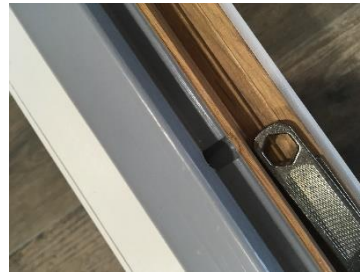
Vue du dessus à l'ouverture de la fenêtre

Déboucher les trous d'évacuation de la pièce d'appui, du seuil et des traverses basses au moins une fois par an.