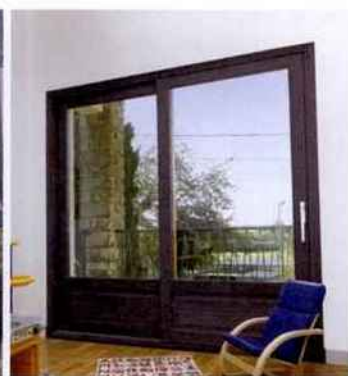
Atulam fait aussi du contemporain. Ici, un coulissant à ouverture automatisée.

boiseries sont encore impeccables », souligne cet "avocat" inlassable du matériau bois.