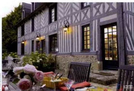
Manoir normand mis à neuf par Atulam, pour qui la rénovation représente 98 % de l'activité.