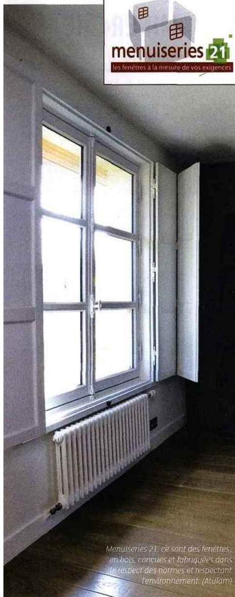
Menuiseries 21, ce sont des fenêtres en bois, conçues et fabriquées dans le respect des normes et respectant l'environnement. (Atulam)

L'adhésion au syndicat français des constructeurs bois implique le respect d'une charte de qualité définissant les contraintes qui s'imposent à ses adhérents. Ainsi, ces constructeurs bois s'engagent à respecter les règles de l'art et les réglementations en vigueur ; respecter les engagements contractuels (qualité, prix et délais convenus, garanties et assurances légales) ; respecter l'environnement (augmentation des bois éco-certifiés, réduction, gestion et valorisation des déchets) ; adopter une gestion « citoyenne » de leurs chantiers ; et assurer un service de qualité envers le client (orientation, conseil, SAV).