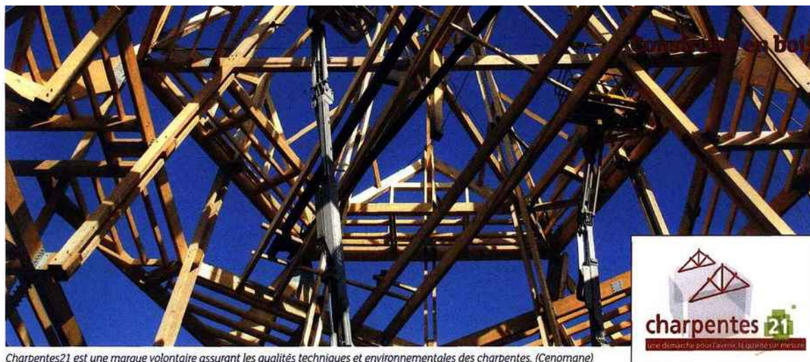
Charpentes21 est une marque volontaire assurant les qualités techniques et environnementales des charpentes. (Cenomane)