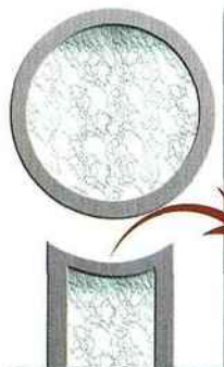
Doc. Art & Fenêtres