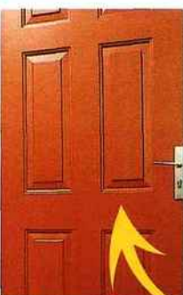
Doc. Lapeyre la maison...