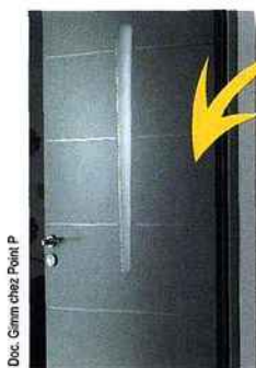
Doc. Gamm chez Point P