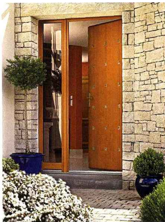
Raffinée. Porte en moabi avec incrustations de granit, associée à une partie fixe vitrée isolante. «Théorème», Pasquet menuiseries.

Les vitrages demi-lune reculent au profit de surfaces vitrées plus importantes. Les vitrages décoratifs et les incrustations de matériaux séduisent (clous, inox, pierre, etc.). Le noir tente une percée, tandis que les motifs brillants ou mats procurent un certain chic, très apprécié.